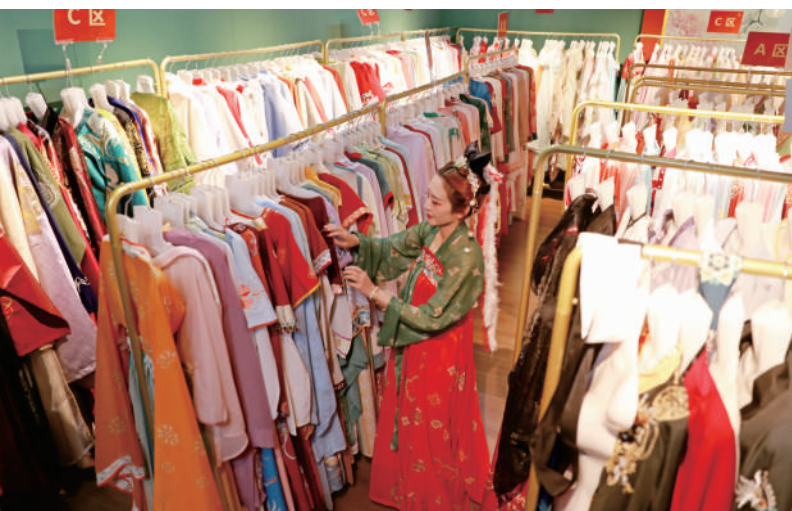
游客在汉服体验馆挑选汉服